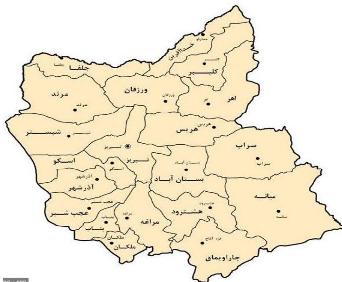
تصویر ۱- استان آذربایجان شرقی و شهرستان های تحت پوشش